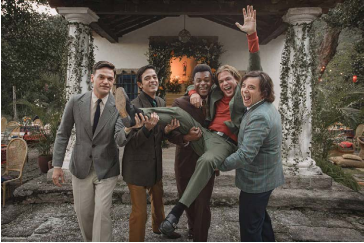
Elenco da série baseada em livro de Fernanda Torres

“Fim”, em cartaz no Globoplay, aborda - com toques de poesia - a finitude da existência. Para tanto, a trama, baseada em romance de mesmo nome publicado pela atriz e escritora Fernanda Torres, mescla momentos solares com outros, digamos, de textura soturna. Em outras palavras, o público vê uma tragicomédia que se passa no Rio de Janeiro.