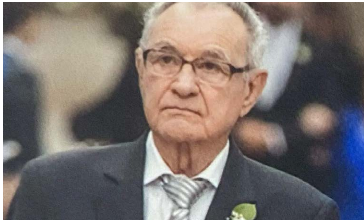
Osmar Cabral: longa trajetória pública