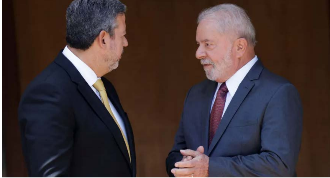
Arthur Lira e Lula da Silva: Centrão ocupa mais cargos na Esplanada

Lula chamou a presidente da Caixa, Rita Serrano, para uma conversa nesta quarta-feira, 25, no Palácio do Planalto, para informar de sua demissão. Serrano era da cota pessoal de Lula, mas deputados e senado-