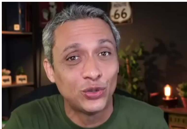
Gustavo Gayer: envolvido em nova polêmica