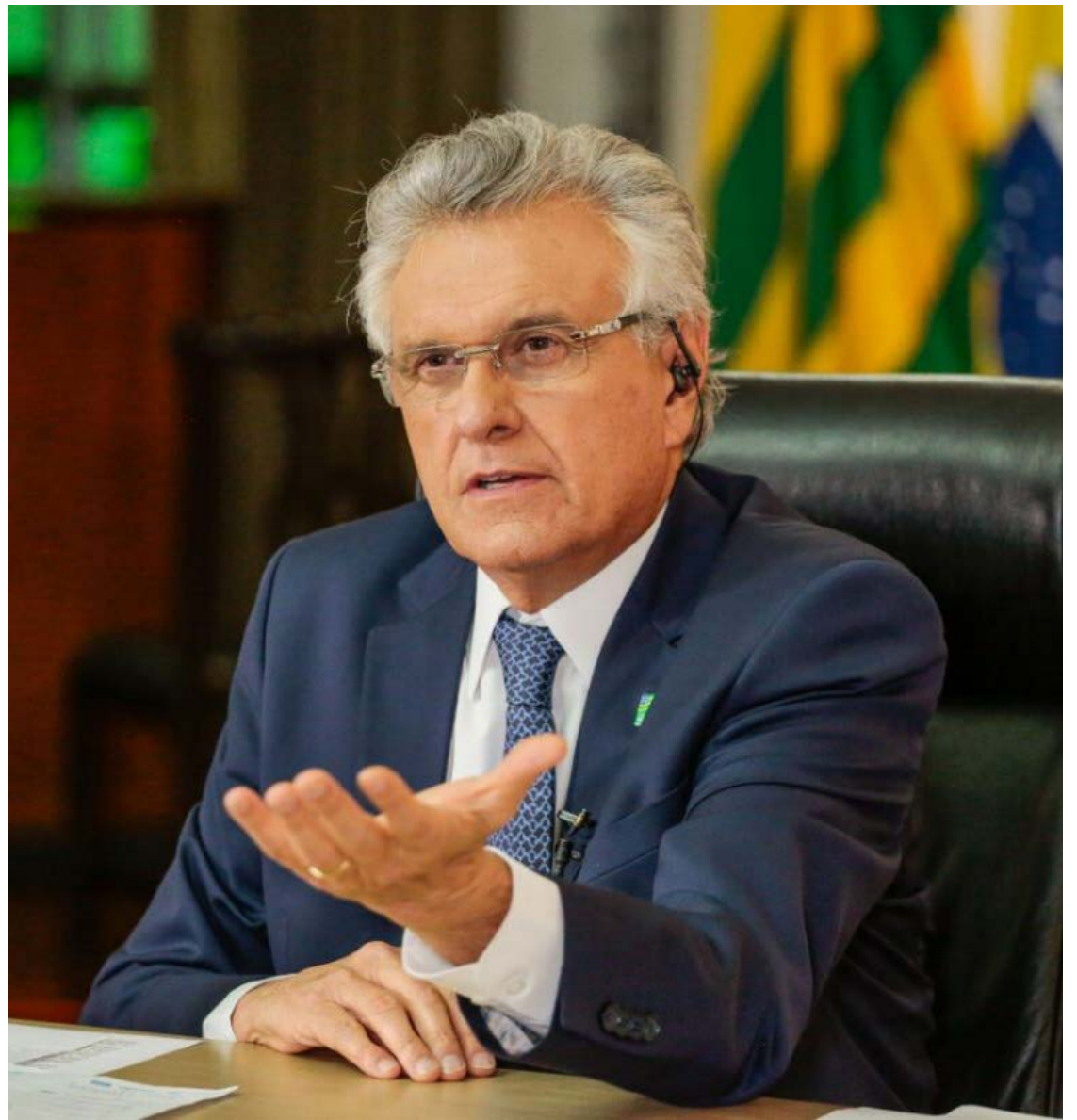
Ronaldo Caiado: projeto presidencial para debater o futuro do país a partir de 2026

Embora sempre esteve na oposição ao PT, desde a Constituinte de 1988, Ronaldo Caiado ressaltou que, como governador de Goiás, mantém uma relação