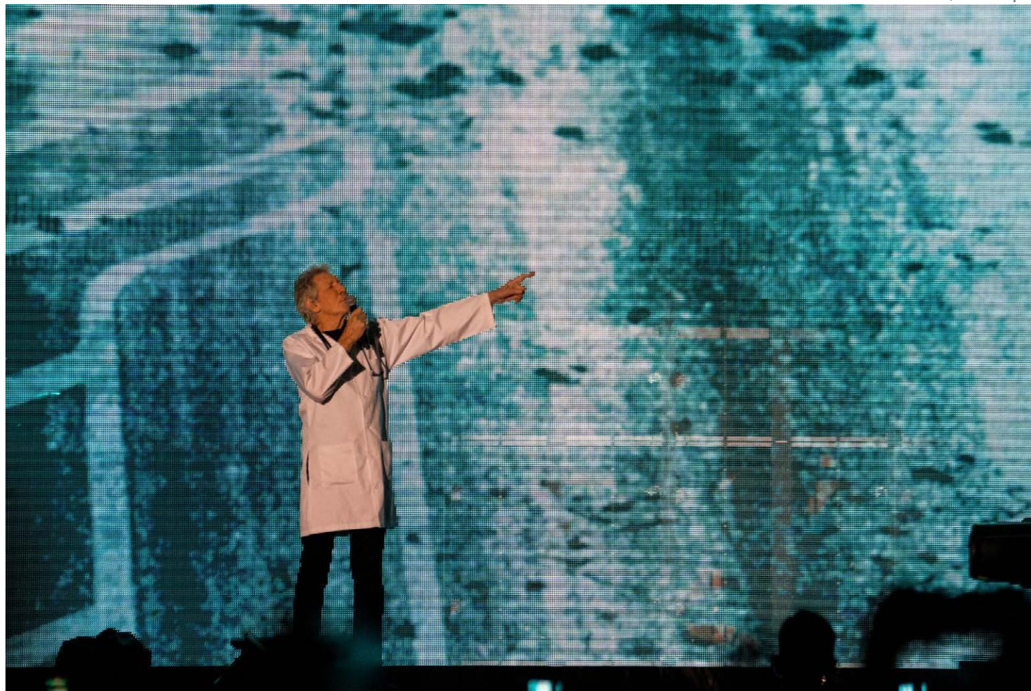
Experiência estética: concerto foi carregado de carga política com banda afiada

Isso tudo ocorreu nos loucos anos 1960. Barrett e Waters eram amigos. “Você vive