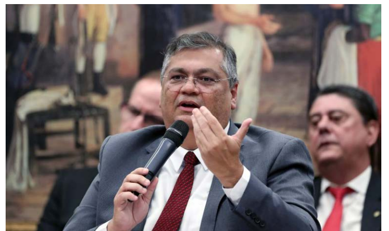
Flávio Dino: duros embates com parlamentares bolsonaristas

A troca de provocações não parou por aí. O ministro reforçou que apenas responderia às perguntas relativas aos temas dos requerimentos. “É a primeira vez que vejo o ministro sem medo de ir à Maré, mas com medo de perguntas”, disse Nikolas Ferreira (PL-MG), autor de um dos três requerimentos.