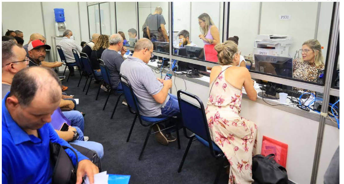
Prefeitura de Goiânia oferece condições especiais e descontos de até 99% em multas e juros para o IPTU/ITU, ITBI e ISS

Além do pagamento à vista, o contribuinte pode optar durante a realização do Novo Refis 2023 pelo parcelamento dos débitos em até 60 meses, com a redução de juros e multas entre 70% e 90%. A novidade para