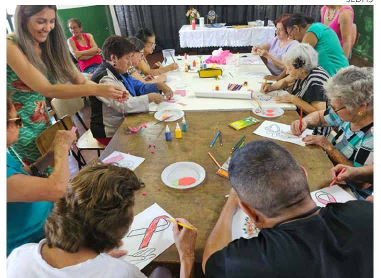
Outubro intensifica campanha de combate ao câncer de mama, em unidades de assistência social

No dia 21/10, o Centro de Referência de Assistência Social (Cras) do Recanto das Minas Gerais promoveu um bate-papo sobre conscientização e prevenção do câncer de mama sob orientação de estudantes e professores do curso de Enfermagem da Universidade Estácio de Sá.